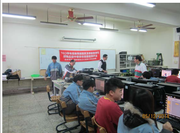
專題製作協同教學