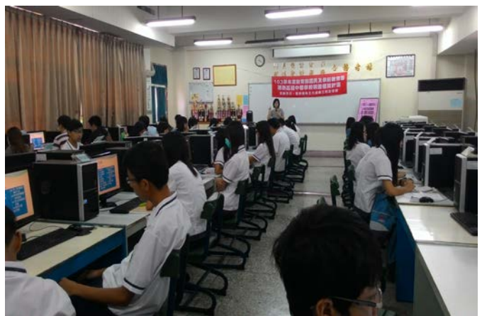
應外/英文教師觀摩