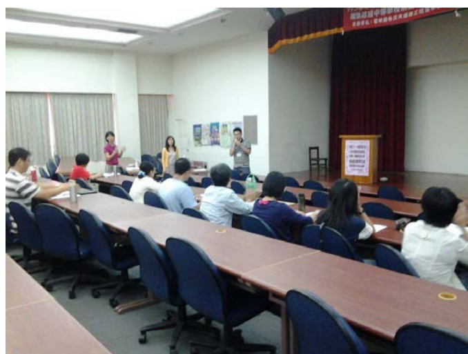
教學組長蒞臨指導