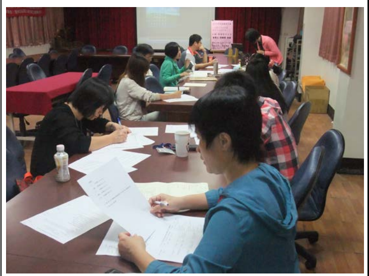
老師社群分享討論