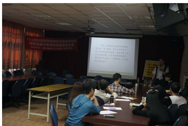
教學經驗提出研討