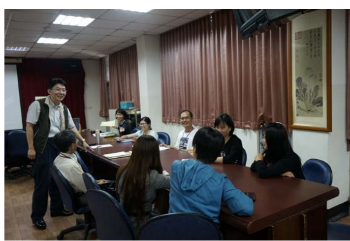
教授與老師們互動分享