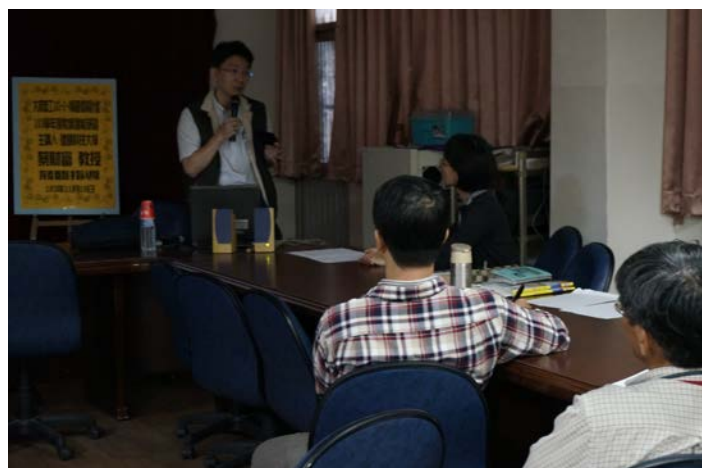
課程與教材教案說明