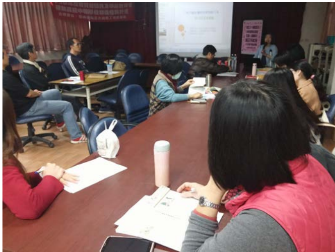
教授蒞臨社群分享