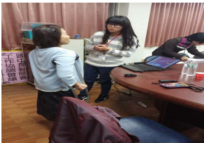
教授與老師經驗分享交流