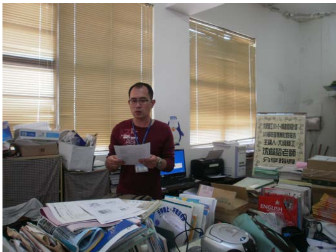
教師進行社群分享