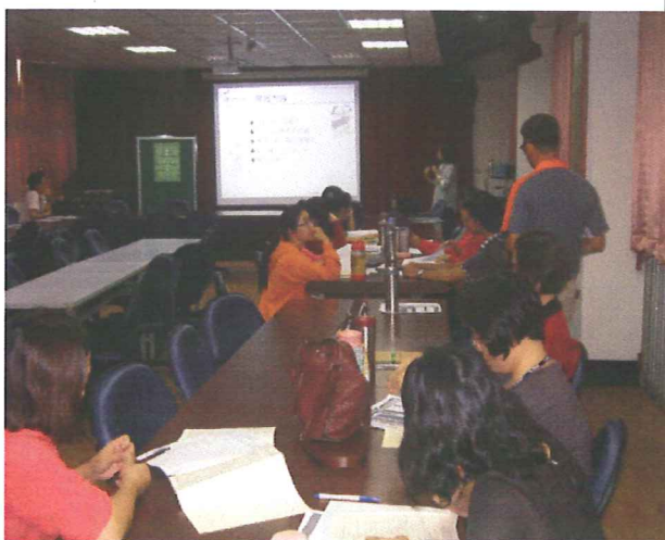
說明：同仁用心聆聽