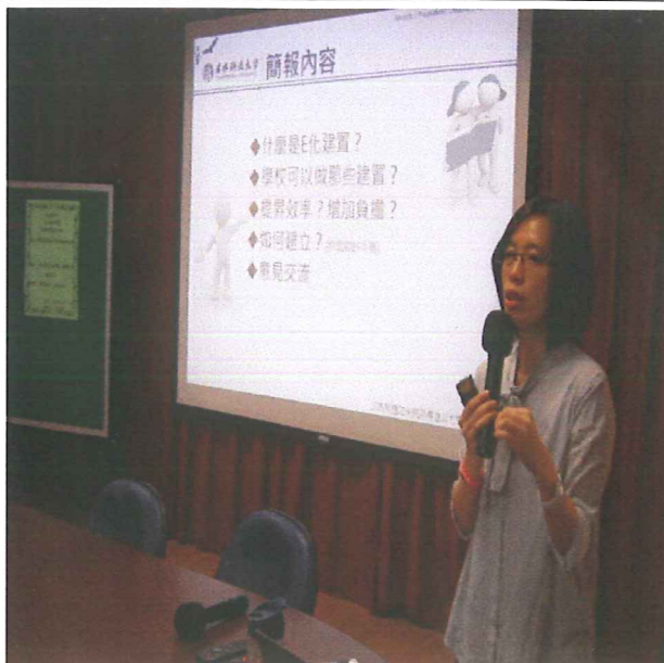
說明：講師用心演講