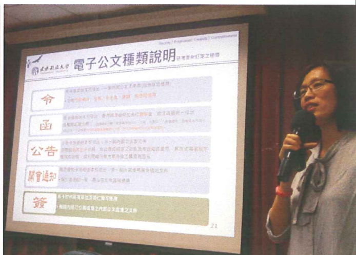
說明：講師用心演講